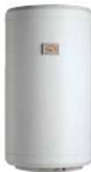
Modelo para instalación vertical