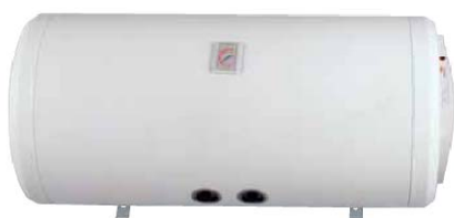
Modelo para instalación horizontal