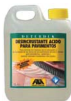
DETERDEK ENVASE 1L CÓD.ART.: 04300001