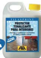
FILASPRINT CÓD.ART.: 04300004