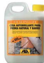
FILALONGLIFE 1L CÓD.ART.: 04300005