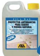
FILA W68 CÓD.ART.: 04300003