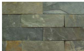
LADRILLO SYDNEY 20x6x1.5 CÓD.ART.: 3600360019