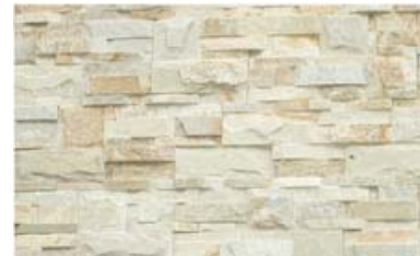
LAJA IGUAZU 18x35x2x2.5 CÓD.ART.: 3600360002

Con LAJANATUR sabrán con antelación como quedara el material aplicado, ahorrando tiempo y asegurando acabados y calidad que con el sistema tradicional de colocación elevaría los costes. LAJANATUR se fabrica en diferentes tipos de piedra natural y también en piezas especiales como esquinas. Su belleza lo hace imprescindible en cualquier decoración de piedra para interior. Grosos de 2 a 2.5 cm.