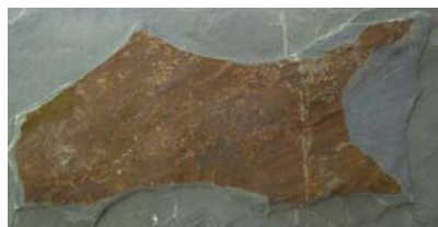
ESCARFILADO ARRECIFE 40x20x2/3 CÓD.ART.: 3600360013