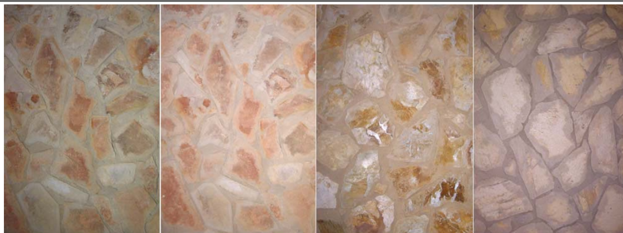
Muestras de fachadas con piedra de laja