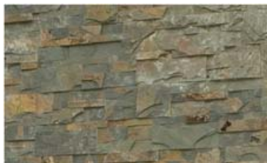
LAJA ARRECIFE 18x35x2-2.5 CÓD.ART.: 3600360006

LAJANATUR es un novedoso e innovador sistema de colocación de piedra natural encolada sobre malla. Ideal tanto para exterior como interior, un producto que aumenta el rendimiento de colocación hasta 7 veces. No necesita de personal especializado para su colocación, abaratando costes y con el que además no generara desperdicios.