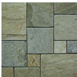
MOSAICO MONTREAL 30.5x30.5x1 CÓD.ART.: 3600360041