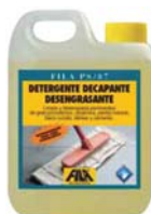
FILA PS/87 CÓD.ART.: 04300002