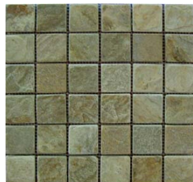
MOSAICO CANADA 30.5x30.5x1 CÓD.ART.: 3600360026