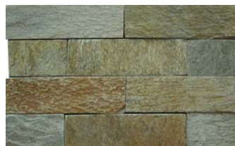
LADRILLO IGUAZU 20x6x1.5 CÓD.ART.: 3600360020